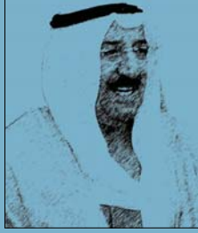
حضرة صاحب السمو أمير البلاد الشيخ / صباح الأحمد الجابر الصباح