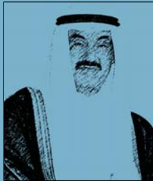
سمو رئيس مجلس الوزراء الشيخ / ناصر المحمد الصباح